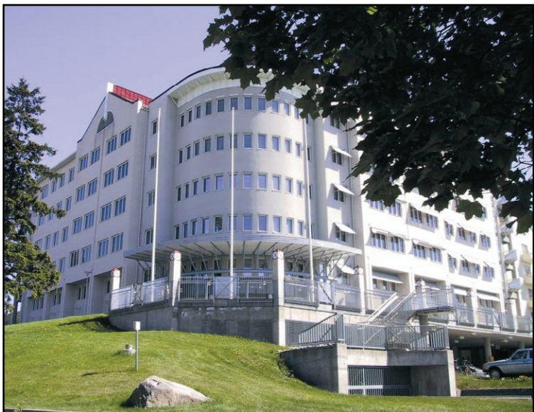
Turun kirurginen sairaala on yksi Ansion Sementtivalimon toteuttamista valmisbetonikohteista.

Ansion Sementtivalimon elementtirakentamisen kohteita taas ovat olleet mm. Pharmacy, Kauppakeskus Mylly ja Turun oikeustalo. Tällä hetkellä rakenteilla olevia merkittäviä elementtikohteita ovat Empon koulurakennus ja logistiikkayhtiö Transpointin hallitilat.