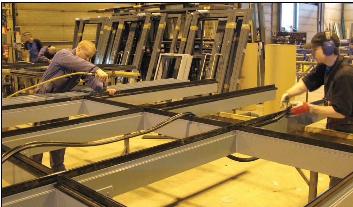
Näyttävät metallirakenteet valmistuvat ammattilaisvoimin.