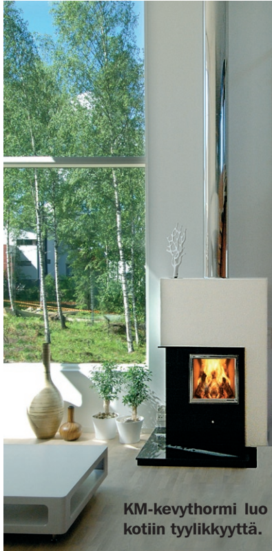
KM-kevythormi luo kotiin tyylikkyyttä.

Kurkelan Metallituote Oy on vuonna 1993 perustettu yritys, jonka kotipaikka on Kaarina. Yritys toimii omissa hallitiloissaan Krossin teollisuusalueella hyvien liikenneyhteyksien varrella. Päätuotteena olevien KM-hormien valmistuksen lisäksi yrityksen tuotevalikoimaan kuuluvat erilaiset metalliset takkojen ja uunien osat.